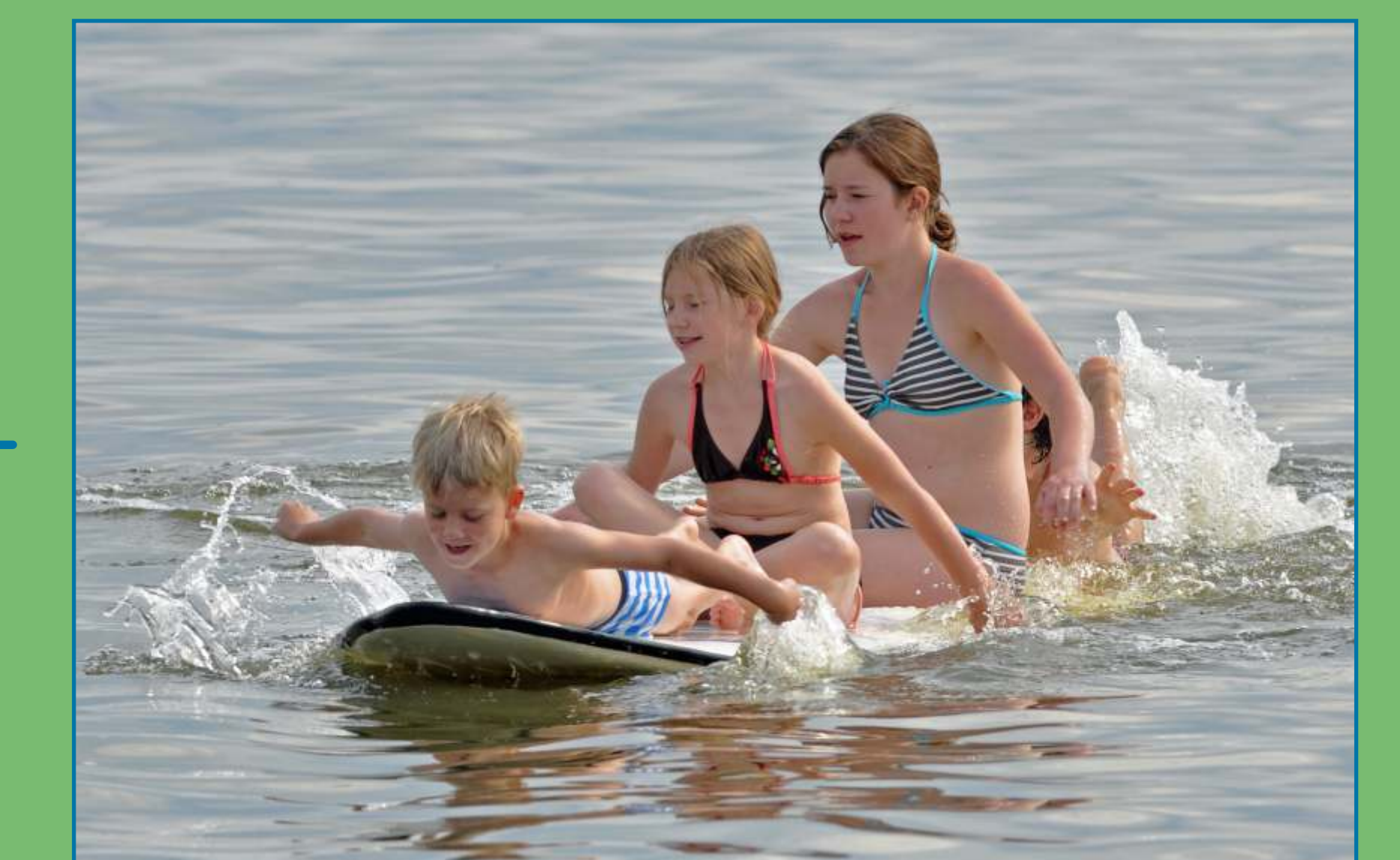
Kinder sind besonders gefährdet!

Weitere Fragen zur Badewasserqualität des Dümmer beantwortet Ihnen: